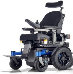
SANGO MWD Sitzmodul SEGO junior