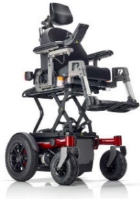
SANGO RWD Sitzmodul SEGO junior