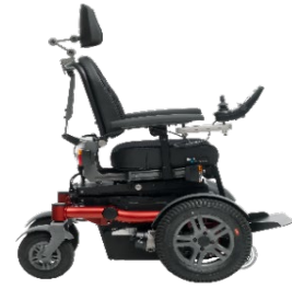
SANGO FWD Sitzmodul SEGO junior