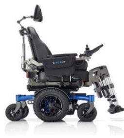
SANGO MWD Sitzmodul SEGO comfort