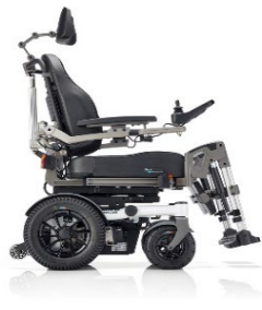
SANGO RWD Sitzmodul SEGO comfort