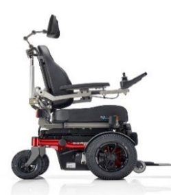
SANGO FWD Sitzmodul SEGO comfort