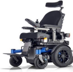
SANGO MWD Sitzmodul SEGO junior