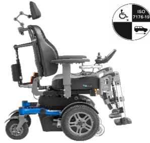
SANGO xx-large FWD Sitzmodul SEGO